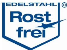
Legierungszuschläge Bleche in €/kg